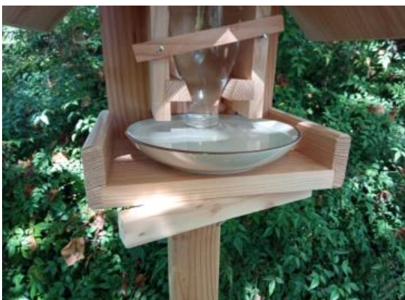
Le bord se fixe sous le plateau en mode abreuvoir