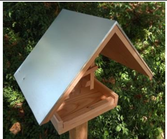
M-O-P-CT Toit bois entièrement recouvert de tôle