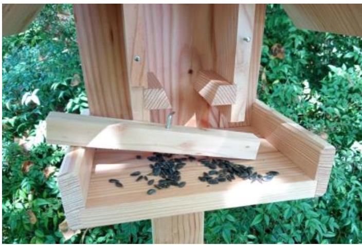
Nettoyage facile : bord amovible