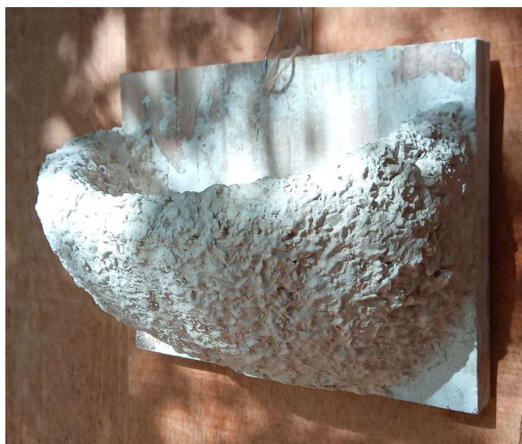
Photo bientôt disponible